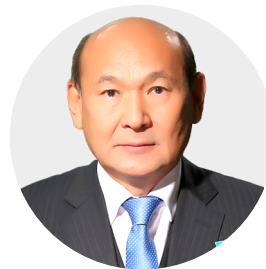
Ақшолақов Серік Қуандықұлы

Қазақстан Республикасы Атом энергиясы агенттігі Басқарма төрағасының орынбасары Астана, Қазақстан